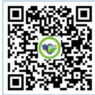
สถิตีย้อนหลัง 5 ปี