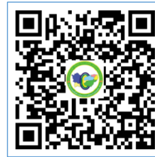
แยกกลุ่มโรงเรียน